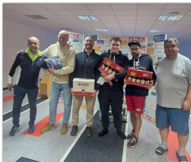
uprostřed vlevo „Kulhavky“, vpravo „Mal“ s pořadatelem